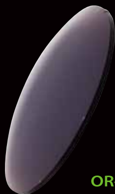
OR-BIKE | オートバイ 春・夏用 |