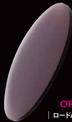
OR-ROAD | ロードバイク 春・夏用 |