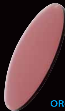
OR-WINTER | 秋・冬用 |